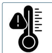
No apto para altas temperaturas